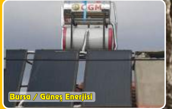
Bursa / Güneş Enerjisi