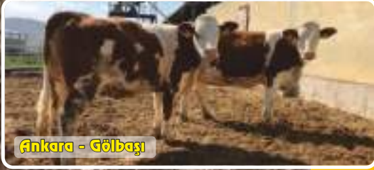
Ankara - Gölbaşı