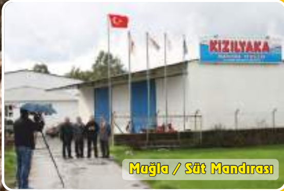
Mağla / Süt Mandırası