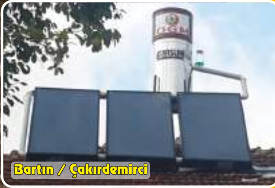
Bartın /  akırdemirci