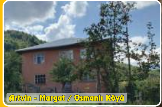
Artvin - Margut / Osmanlı Köyü