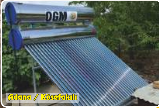
Ađana / K sefakılı