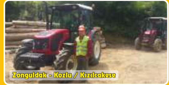
Zonguldak - Kozlu / Kızılcakese