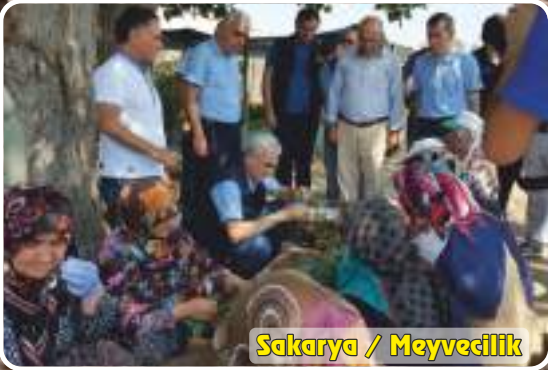
Sakarya / Meyvecilik