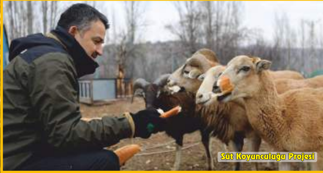
Süt Koyuncululuđu Projesi