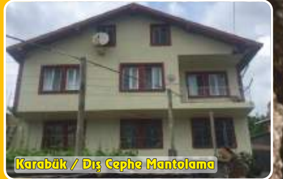
Karabük / Dış Cephe Mantolama