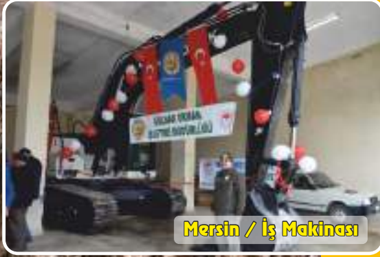
Mersin / İş Makinesi