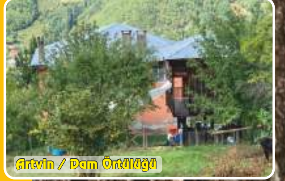
Artvin / Dam Örtülüğü