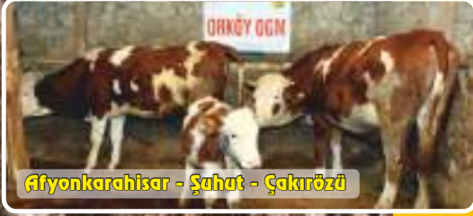
Afyonkarahisar - Şahat - Çakırözü