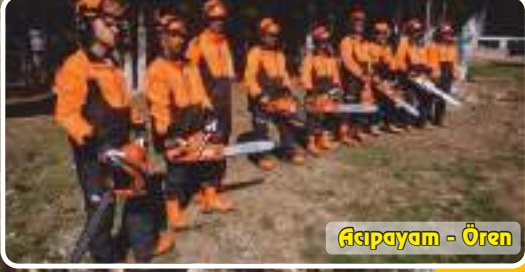
Asıpayam - Ören