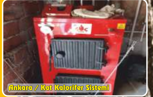
Ankara / Kat Kalorifer Sistemi