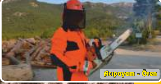
Asıpayam - Ören