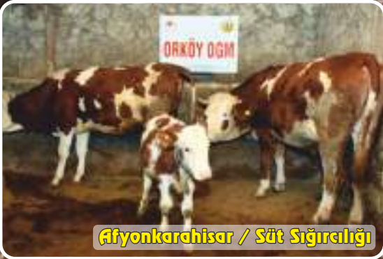
Afyonkarahisar / Süt Sığırcılığı