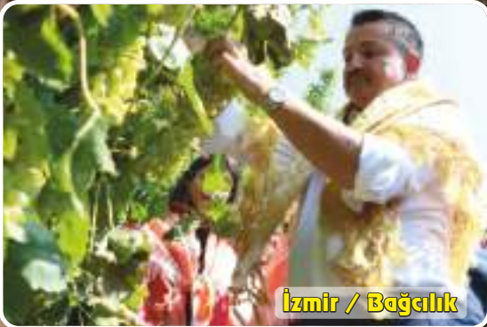
İzmir / Bağcılık