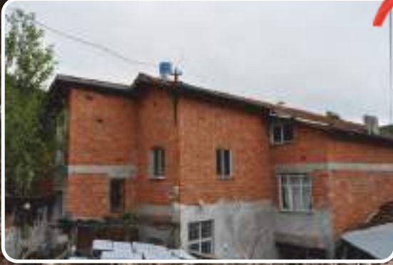
Karabük - Eskipazar / Köyceğiz (Öncesi)