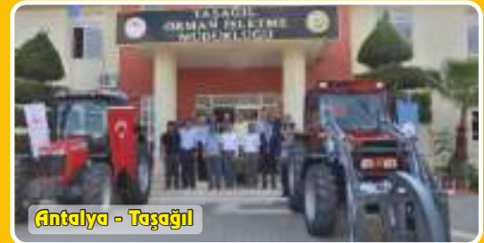
Antalya - Taşagül