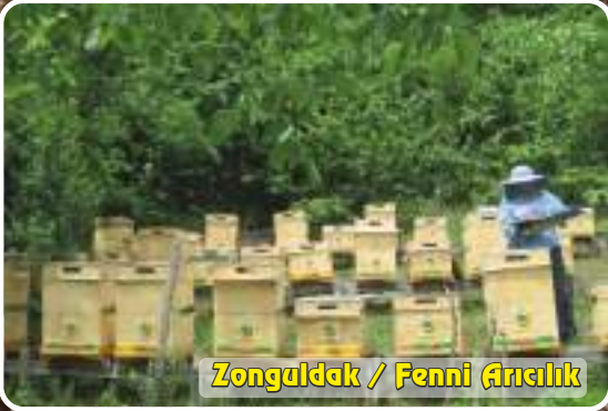
Zonguldak / Fenni Arıcılık