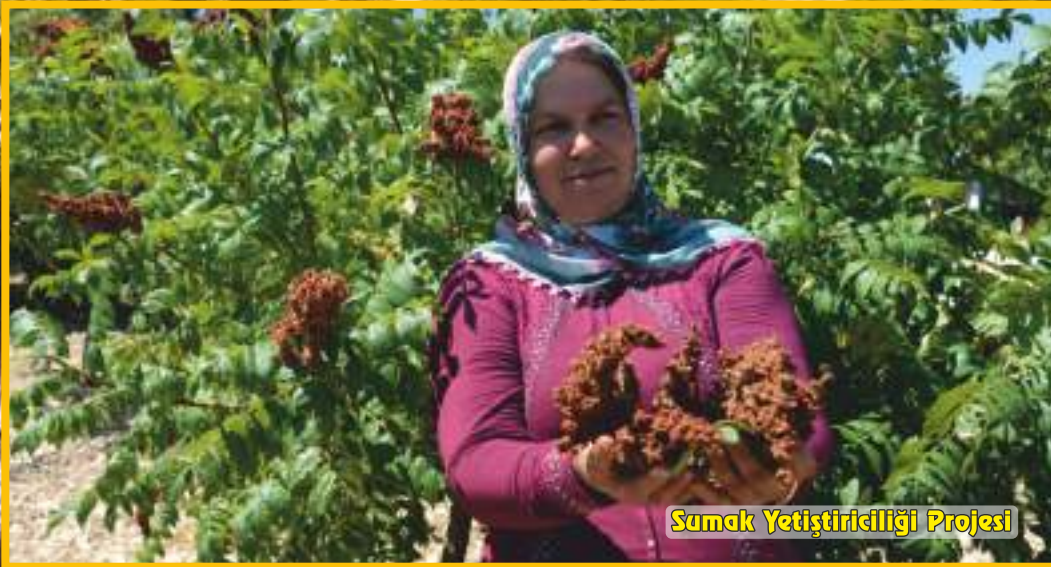
Sumak Yetiřtiriciliđi Projesi