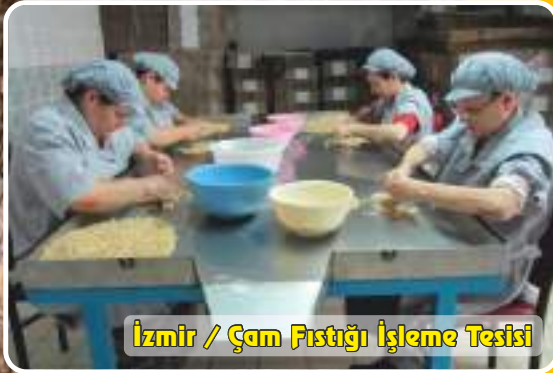
İzmir / Çam Fıstığı İşleme Tesisi