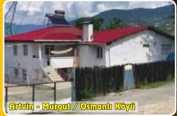
Artvin - Margut / Osmanlı Köyü