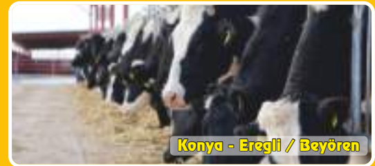
Konya - Ereğli / Beyören