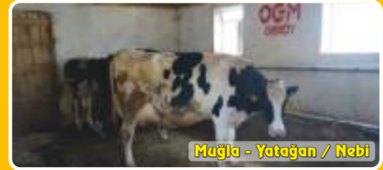
Muğla - Yatağan / Nebi