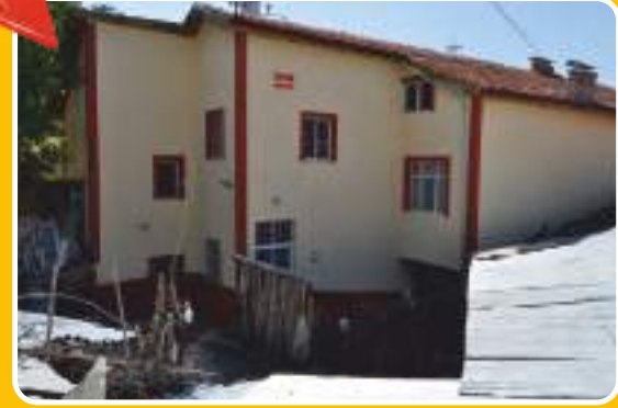
Karabük - Eskipazar / Köyceğiz (Sonrası)