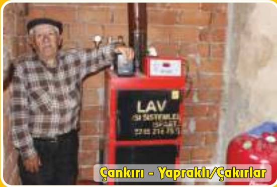
Çankırı - Yapraklı/Çakırlar