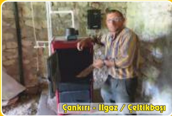
Çankırı - Ilgaz / Çeltikbaşı